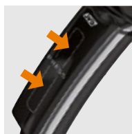
SISTEMA DE ENCENDIDO PATENTADO